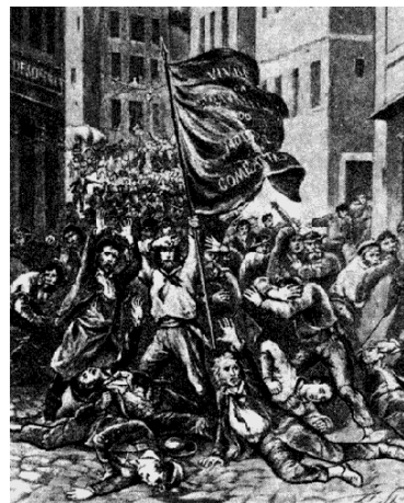
Восстание в Лионе

Черное знамя впервые подняли в марте 1831 г. взбунтовавшиеся землекопы в Реймсе (Франция), написав на нем: "Труд или смерть!". Позднее в Лионе группа землекопов была за то же самое отправлена на гильотину. А 21 ноября 1831 г. в Лионе войска расстреляли манифестацию уволенных ткачей. В ответ вспыхнуло восстание. Мгновенно были сооружены баррикады, и над ними взвилось черное знамя с девизом: "Жить работая или умереть сражаясь!". Это было первое в истории массовое восстание рабочего класса. Черное знамя служило символом отчаяния и нищеты рабочих, готовых скорее умереть в борьбе за свои права, чем терпеть несправедливость. Кроме того, черный цвет стал связываться с антимонархической борьбой - ведь традиционным цветом монархии считался белый.