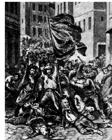
Восстание в Лионе

Черное знамя впервые подняли в марте 1831 г. взбунтовавшиеся землекопы в Реймсе (Франция), написав на нем: "Труд или смерть!". Позднее в Лионе группа землекопов была за то же самое отправлена на гильотину. А 21 ноября 1831 г. в Лионе войска расстреляли манифестацию уволенных ткачей. В ответ вспыхнуло восстание. Мгновенно были сооружены баррикады, и над ними взвилось черное знамя с девизом: "Жить работая или умереть сражаясь!". Это было первое в истории массовое восстание рабочего класса. Черное знамя служило символом отчаяния и нищеты рабочих, готовых скорее умереть в борьбе за свои права, чем терпеть несправедливость. Кроме того, черный цвет стал связываться с антимонархической борьбой - ведь традиционным цветом монархии считался белый.