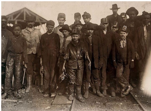
Дети-шахтеры в штате Алабама, США, конец XIX века.

В Российской империи, частью которой тогда была и Беларусь, дела